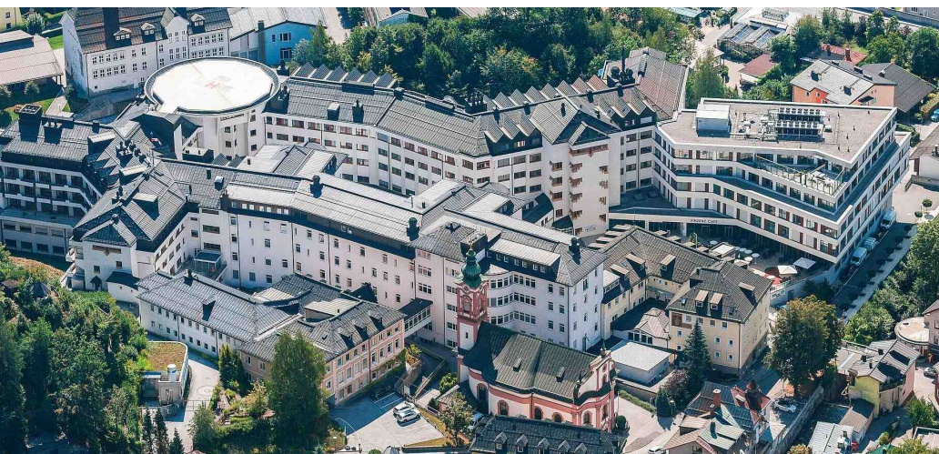
Das BKardinal Schwarzenberg Klinikum in Schwarzach.

Nirgendwo werden so hohe Anforderungen an die Trinkwasserhygiene gestellt, wie in einem Krankenhaus. Schließlich können Infektionserreger im Trinkwasser bei prädisponierten Personen schwere Erkrankungen auslösen. Berührungslose Armaturen von Schell sorgen nicht nur für einwandfreie Nutzerhygiene, sondern unterstützen auch beim Erhalt der Trinkwassergüte. Mit dem SSC Bluetooth®-Modul – einer kleinen Steuereinheit – können automatisch und termingesteuert Stagnationsspülungen durchgeführt werden. Auf diese Weise werden Bakterien ausgespült, die sich während eines Wasserstillstands in den Leitungen vermehren. Auch im Kardinal Schwarzenberg Klinikum in Schwarzach/Österreich setzen die Betreiber zum Schutz der Gesundheit von Mitarbeitern und Patienten auf die smarten Lösungen von Schell.